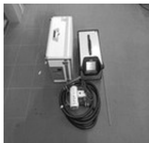
Multigas analizator HORIBA PG350