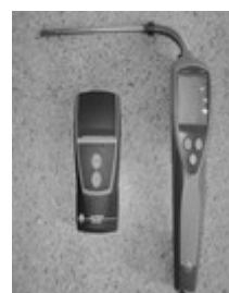
Digitalna dimna pumpa “TESTO” 308