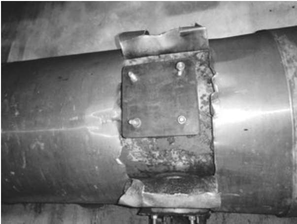
Slika 2. Položaj mernog mesta kotla 1