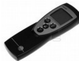
Digitalni termometar “TESTO” 925