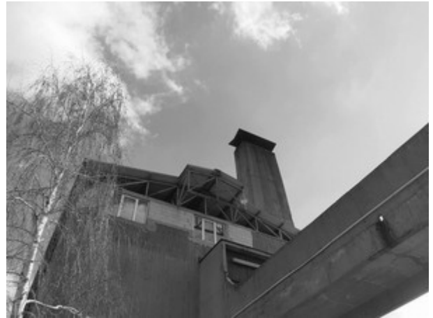
Slika 3. Izgled emitera