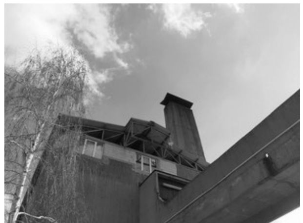
Slika 5. Izgled emitera