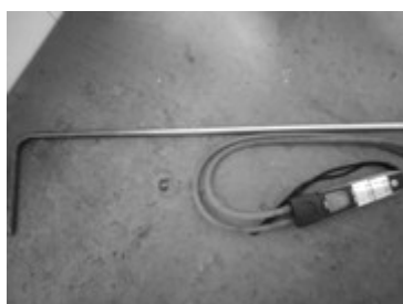
Digitalni anemometar “TESTO” 510i