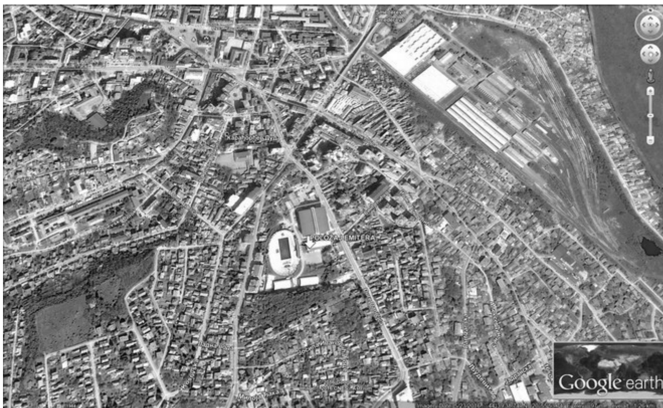
Slika 1. Prikaz makrolokacije

Kotlarnica “SPORTSKI CENTAR”, je u Smederevu, Đure Daničića 6, u stambenoj zoni grada. U neposrednoj blizini kotlarnice je sportska hala i gradski bazen.