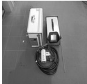
Multigas analizator HORIBA PG350