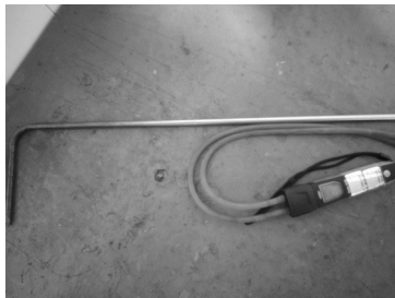
Digitalni anemometar “TESTO” 510i