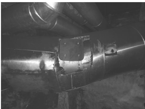
Slika 2. Položaj mernog mesta kotla 1