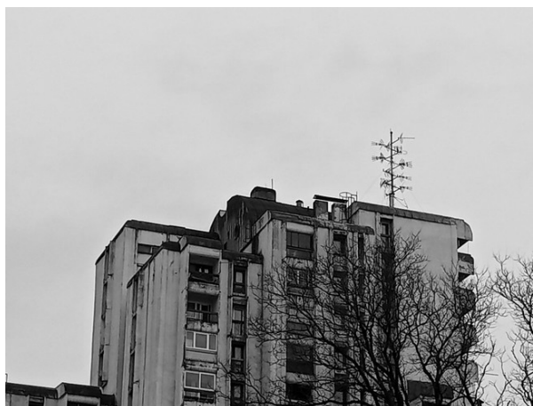
Slika 4. Izgled emitera