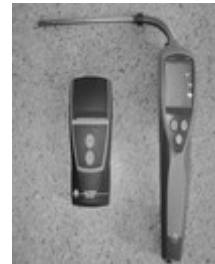
Digitalna dimna pumpa “TESTO” 308