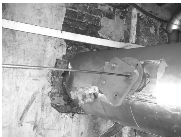
Slika 3. Položaj mernog mesta kotla 2