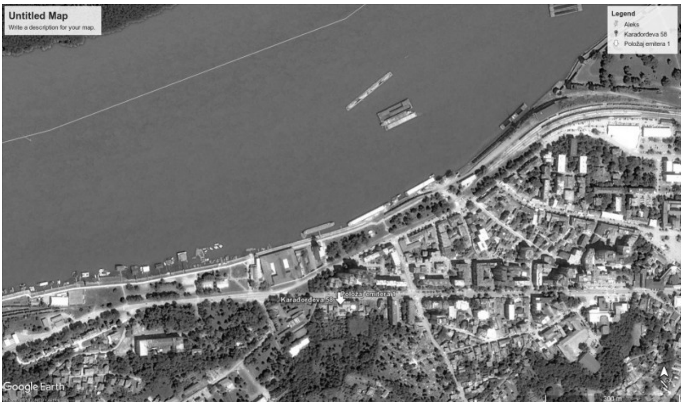
Slika 1. Prikaz makrolokacije

Lokacija kotlarnice “SOLIDARNOST” je u Smederevu, Karadordeva 58, u stambenoj zoni grada. U neposrednom okruženju su stambeni objekti individualnog i kolektivnog karaktera stanovanja.