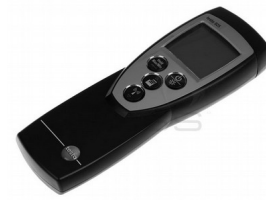
Digitalni termometar “TESTO” 925