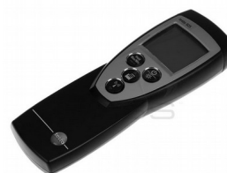
Digitalni termometar "TESTO" 925