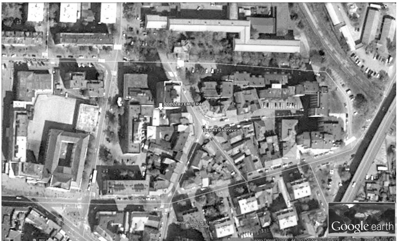
Slika 1. Prikaz makrolokacije

Lokacija kotlarnice “CENTROPROM”, je u Smederevu, Branka Radičevića 1, u dvorištu stambene zgrade. U neposrednoj blizini kotlarnice su objekti kolektivnog karaktera stanovanja. Zapadno od kotlarnice “CENTROPROM” je “Gimnazija Smederevo” i Hram “Svetog Đorđa”, dok je sa severne strane “Maksi” i “Tehnička škola Smederevo”.