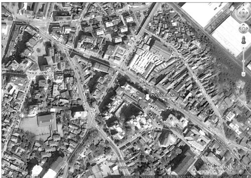
Slika 1. Prikaz makrolokacije

Lokacija kotlarnice “PARNJAČA”, je u centru Smedereva, u ulici 17. oktobra broj 16. U neposrednoj blizini kotlarnice su objekti individualnog i kolektivnog karaktera stanovanja. Jugoistočno od kotlarnice je Tekstilno-tehnološka i poljoprivredna škola “Despot Đurađ”.