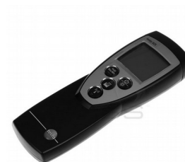
Digitalni termometar "TESTO" 925