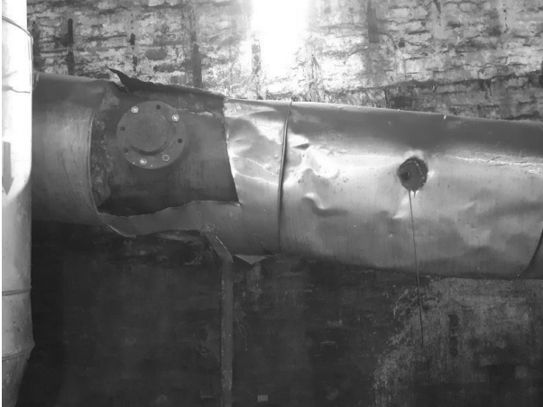
Slika 2. Položaj mernog mesta

Merno mesto obezbeđuje uslove da je ugao strujanja gasova manji od 15% u odnosu na osu emitera, da nema negativnog strujanja gasa, da je minimalna brzina veća od granice detekcije za merenje protoka (diferencijalni pritisak u kanalu veći od 5 Pa). Zadovoljen je uslov homogenosti i neometanog strujanja.