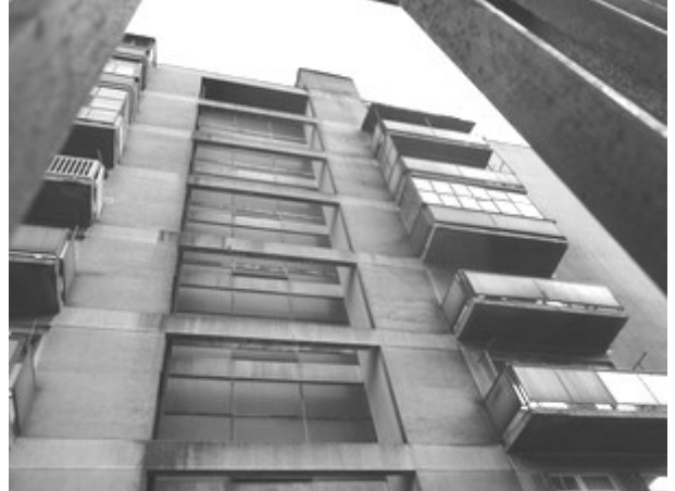
Slika 3. Izgled emitera