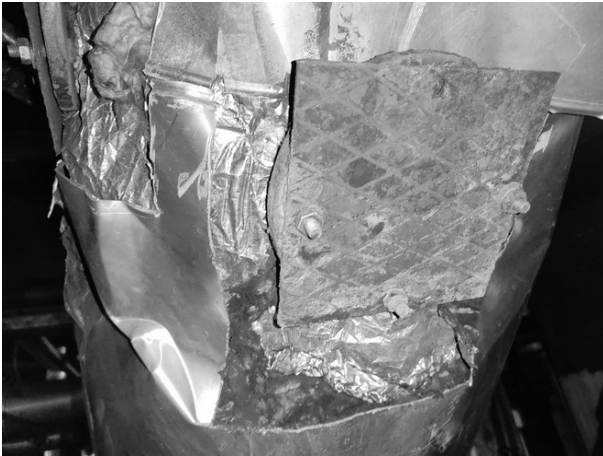
Slika 2. Položaj mernog mesta kotla 1