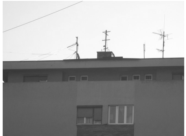
Slika 5. Izgled emitera